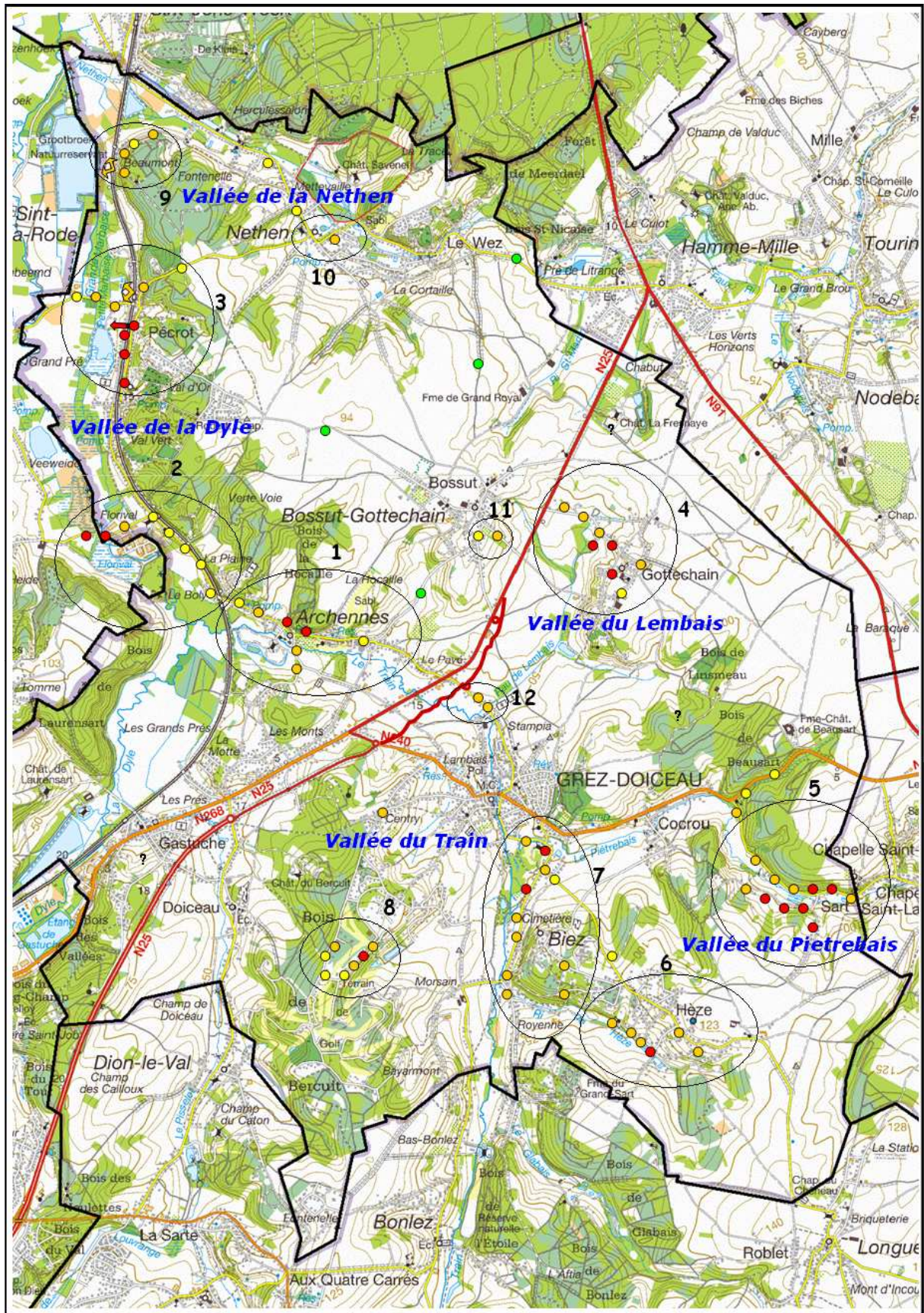
Commune de GREZ-DOICEAU : cartographie des zones de traversées par les batraciens sur le territoire communal